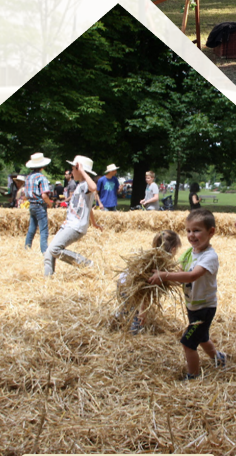
Une piscine de paille et des jeux flamands pour petits et grands !

AU PROGRAMME : QUE DES ASSOCIATIONS, ARTISANS, ARTISTES ET INTERVENANTS DU BASSIN-MINIER ET DE LA MÉTROPOLE LILLOISE.