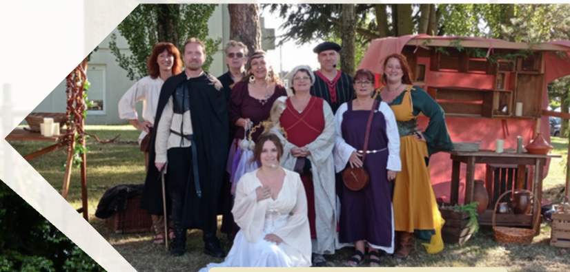
Initiation à la Danse Médiévale avec Les Emer'Veilleurs (Bully-les-Mines)